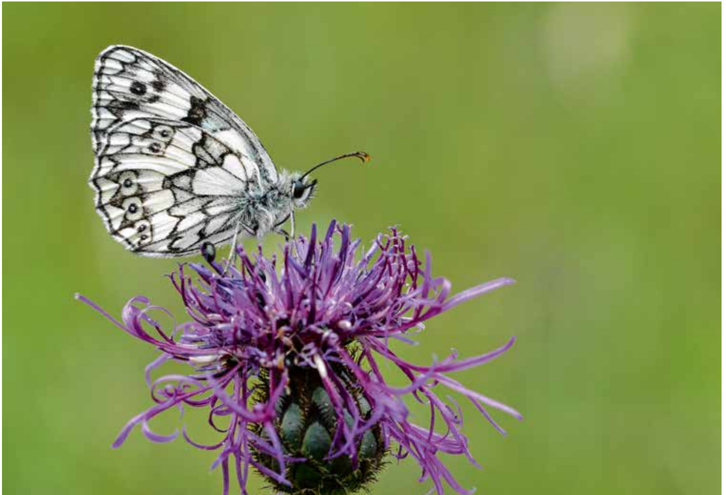
Abb. 1: Das neue Forschungsprojekt zum Insektenmonitoring nimmt sowohl Tagfalter und Widderchen als auch Heuschrecken in den Fokus, um die Entwicklung von Arten wie dem Schachbrettfalter ( Melanargia galathea ) zu dokumentieren

konnte in 63 Naturschutzgebieten Nordrhein-Westfalens, Brandenburgs und in Rheinland-Pfalz zwischen 1989 und 2016 ein Rückgang der in den eingesetzten Malaisefallen vorwiegend gefangenen flugfähigen Insekten (Biomasse) im Mittel von 76 Prozent nachgewiesen werden (HALLMANN et al. 2017).