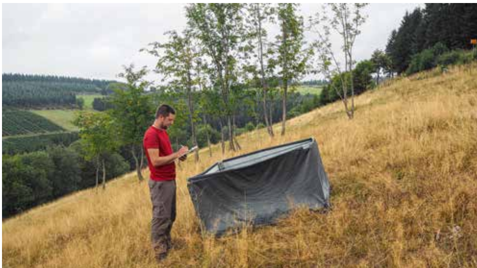
Abb. 3: Trotz seiner Größe eignet sich das Isolationsquadrat dank des leichten und mobilen Gestänges sehr gut für die Erfassung von Heuschrecken im Gelände, denn Arten- und Individuenzahlen lassen sich damit präzise ermitteln

Erste Ergebnisse zu Artenzahlen und Bestandsdichten sind bereits mit Abschluss der Erfassungen 2019 zu erwarten. Vorläufige „Trends“ zu Arten oder Artengruppen lassen sich ab 2020 zunächst über einen Vergleich der jährweisen Ergebnisse und ab dem dritten Jahr erstmals als Trendlinie darstellen. Damit kann das Forschungsvorhaben die Etablierung eines Insektenmonitorings von Beginn an mit beispielhaften Ergebnissen begleiten, auch wenn diese bis zur ersten vollständigen Erfassung der gesamten Stichprobe als vorläufig gelten müssen. Mit einer Fortführung der Erfassungen über 2021 hinaus ist dann der Schritt in ein dauerhaftes Monitoring möglich.