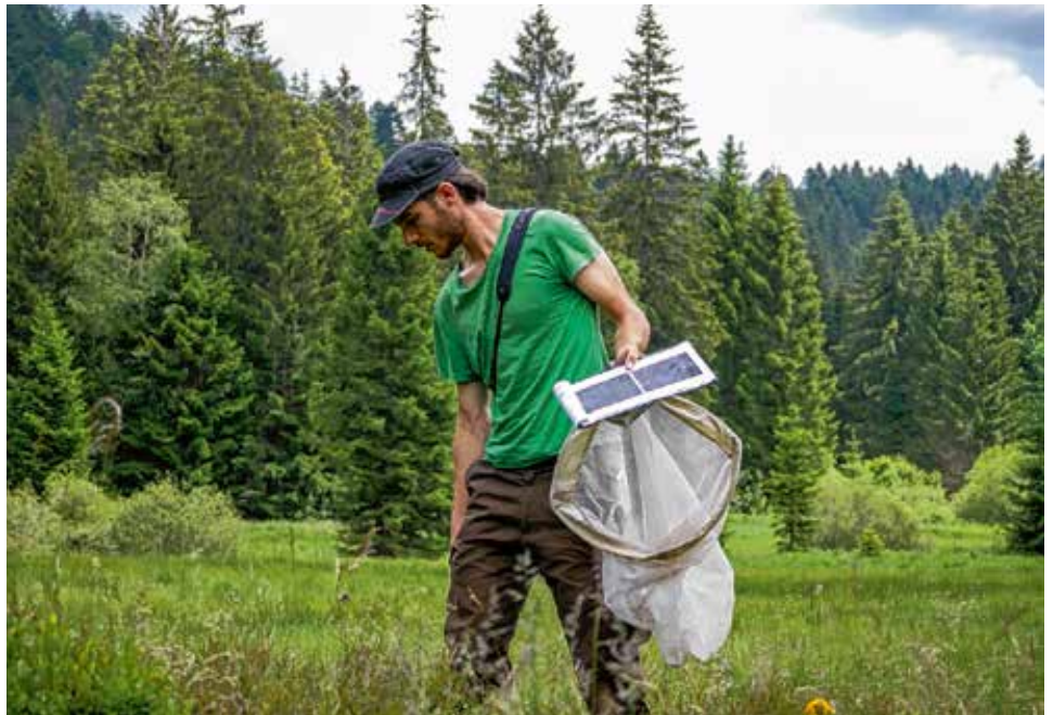
Abb. 2: Tagfalter und Widderchen lassen sich sehr gut entlang von Transekten erfassen. Nur wenige schwer unterscheidbare Arten werden dabei gefangen, nach der Bestimmung jedoch direkt wieder in die Freiheit entlassen.

Mit dem aktuellen Forschungsvorhaben wird die Grundlage für ein dauerhaftes Monitoring geschaffen, mit dem eine bestehende Wissenslücke hinsichtlich des Zustandes und der Entwicklung von Insektenbeständen in Nordrhein-Westfalen geschlossen werden soll. Ziel ist es, basierend auf den im „Einheitlichen Methodenleitfaden“ gegebenen Empfehlungen für standardisierte und repräsentative Erfassungen, zu wissenschaftlich belastbaren qualitativen und quantitativen Aussagen zur Bestandsentwicklung ausgewählter Insektengruppen zu kommen und eine langfristige Dauerüberwachung zu ermöglichen.